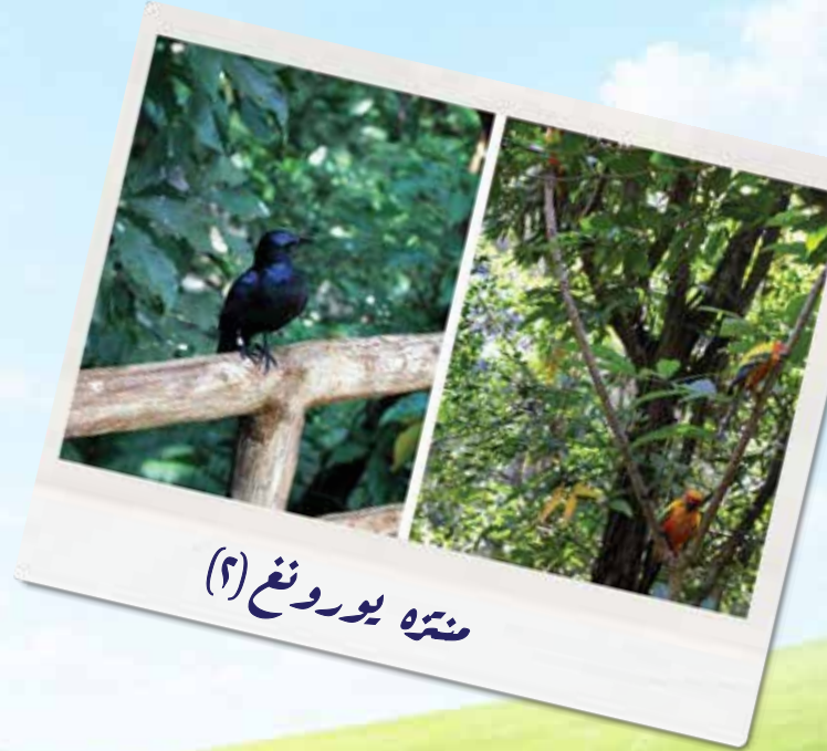
منتره يورونغ (٢)

وأرضُ الحديقةِ يغطيها مرجٌ أخضرٌ كثيفٌ وجميلٌ، يُبهجُ الناظرَ بلونه، وعليه يجلسُ الناسُ الذين يرتادون الحديقةَ للتنزهِ والتمتعِ بالهواءِ العليلِ. كلُّ ذلكِ الجمالِ المبهجِ من صنَعِ اللهِ الذي أحسنَ كلَّ شيءٍ خلقه، فسبحانَ اللهُ الخالقِ العظيمِ. وأذكِّركم أعزائي الأطفالُ أن فصلَ الربيعِ قد بدأ، وصار في إمكانِكُم زيارةَ الحدائقِ والتمتعُ بأجوائها وتسبيحِ الخالقِ سبحانه على ما أبدعه من جمالِ.