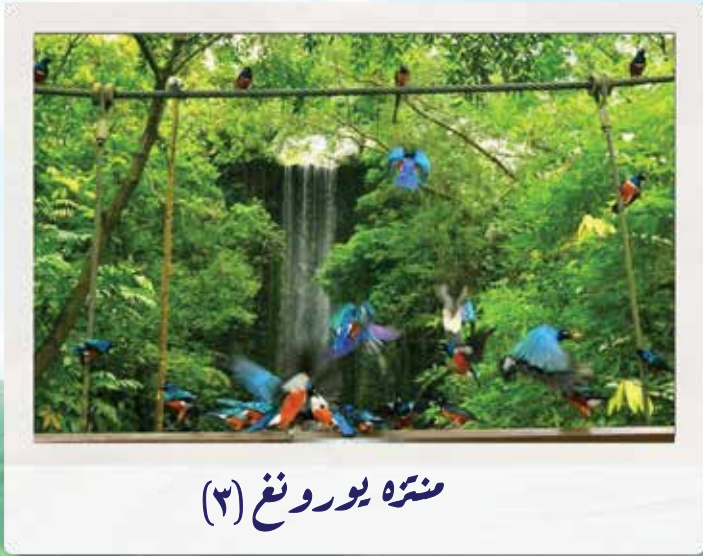
منتره يورونغ (٣)

ويُشكّل كلُّ نوعٍ تجمُّعًا في حديقةٍ معيَّنة، كما في منتره يورونغ في سنغافورة، وهو عبارةٌ عن حديقةٍ توجدُ فيها أنواعٌ كثيرةٌ من الطيورِ من مختلفِ بلدانِ العالمِ، وعندما نتأملُها نتعجَّبُ كيف خلقها اللهُ عزَّ وجلَّ تتكيَّفُ مع الجوّ حَرًّا أو بردًا، وذلك من خلال ريشها وغلظِ ساقَيْها حتى تتمكَّنَ من الطيرانِ، وتتعجب من ألوانها التي تتماشى مع لونِ النباتاتِ والورودِ من حولها، وبالتالي تحميها من خطرِ الصيدِ، ناهيك عن أصواتِ تغريدها العذبِ، فسبحانَ ربي فيما خلق.