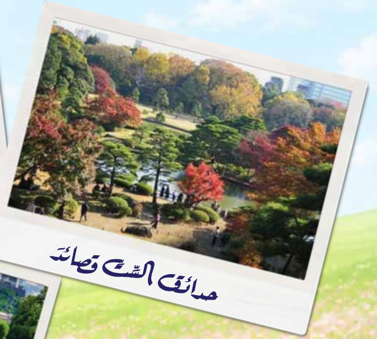
حدائق الشَّ قصائد