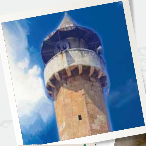
مأذنة الجامع الكبير