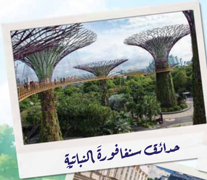
حدائق سنغافورة النباتية

وَسَافِرُ قاصدينَ أجملَ وأشهرَ الحدائق في العالم، مثلَ حدائق سنغافورة النباتية، وحدائق البست قصائد في طوكيو اليابان، وحدائق ميرابل في النمسا، وغيرها الكثير من الحدائق المترامية الأطراف، والتي ترى فيها عجبًا، ففي بعضها تجد تجمُّعًا لطيورٍ مختلفةٍ بأشكالٍ غريبةٍ، وحتى تغريدها فريد من نوعه ويختلفُ عن تغريد الطيور التي اعتدنا رؤيتها.