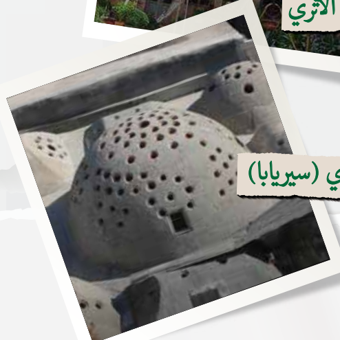
حمام أثري (سيربابا)

بعد انتهاء الصلاة خرج الصديقان، وتابعا جولتهما في المدينة الجميلة، حيث شاهدا بعض البيوت والأبنية القديمة، مثل بيت العياشي الأثري الموجود في وسط المدينة، وأيضًا الحمامات العامة التاريخية ، والأماكن التي كانت فيها الخانات القديمة التي كان يرتاح فيها التجار القادمون من خارج إدلب.