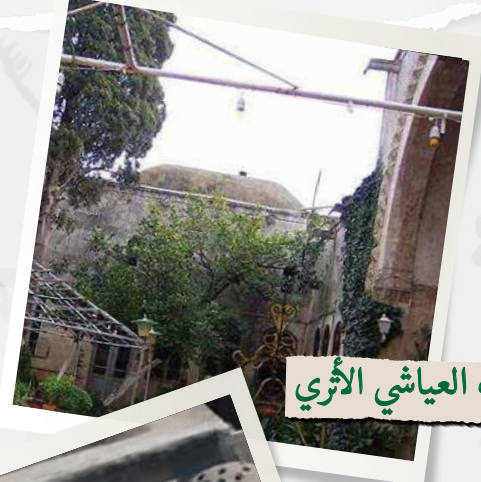
بيت العياشي الأثري

بعد انتهاء الصلاة خرج الصديقان، وتابعا جولتهما في المدينة الجميلة، حيث شاهدا بعض البيوت والأبنية القديمة، مثل بيت العياشي الأثري الموجود في وسط المدينة، وأيضًا الحمامات العامة التاريخية ، والأماكن التي كانت فيها الخانات القديمة التي كان يرتاح فيها التجار القادمون من خارج إدلب.